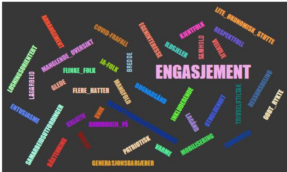
Ordskey 1 – Hva kjennetegner frivilligheten i Inderøy pr 2022?

Spørsmålet ble stilt på innspillkvelden, og svarene oppsummeres i denne ordskyen: