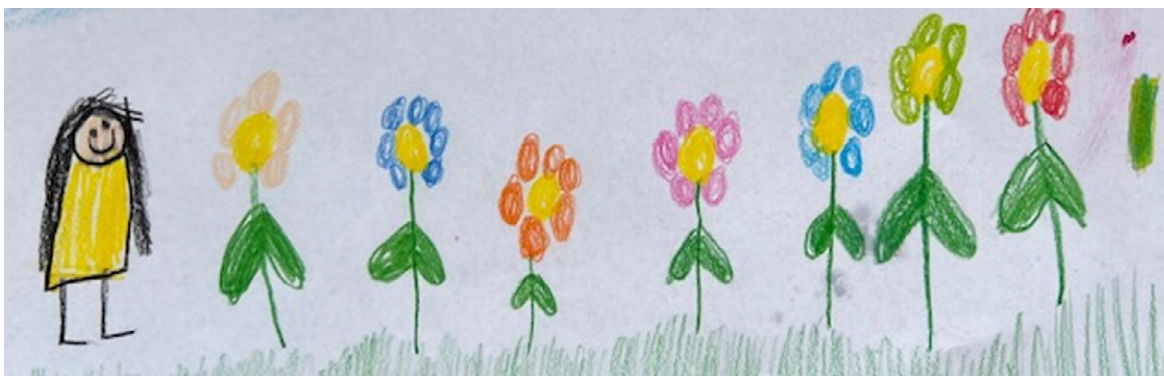
Tegnet av Åsta 6 år

For å møte framtidens behov, trenger vi et mer fleksibelt tverrfaglig team lokalt, som kan trå til bredt på et tidlig tidspunkt ved bekymringer for barn og unges omsorgssituasjon eller atferd. Et slikt tiltak har vi ikke pr i dag.