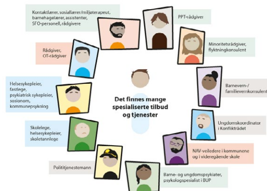
Figur: Regjeringen. Basert på figur utarbeidet av 0-24-samarbeidet ( https://0-24-samarbeidet.no/dokumenter/ )

Når barna har behov for et helhetlig og samordnet tjenestetilbud, skal barna og deres foreldre slippe å ta ansvar for å koordinere samarbeidet 24